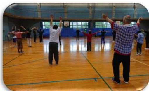
ヴェルディ・スポーツ教室の様子